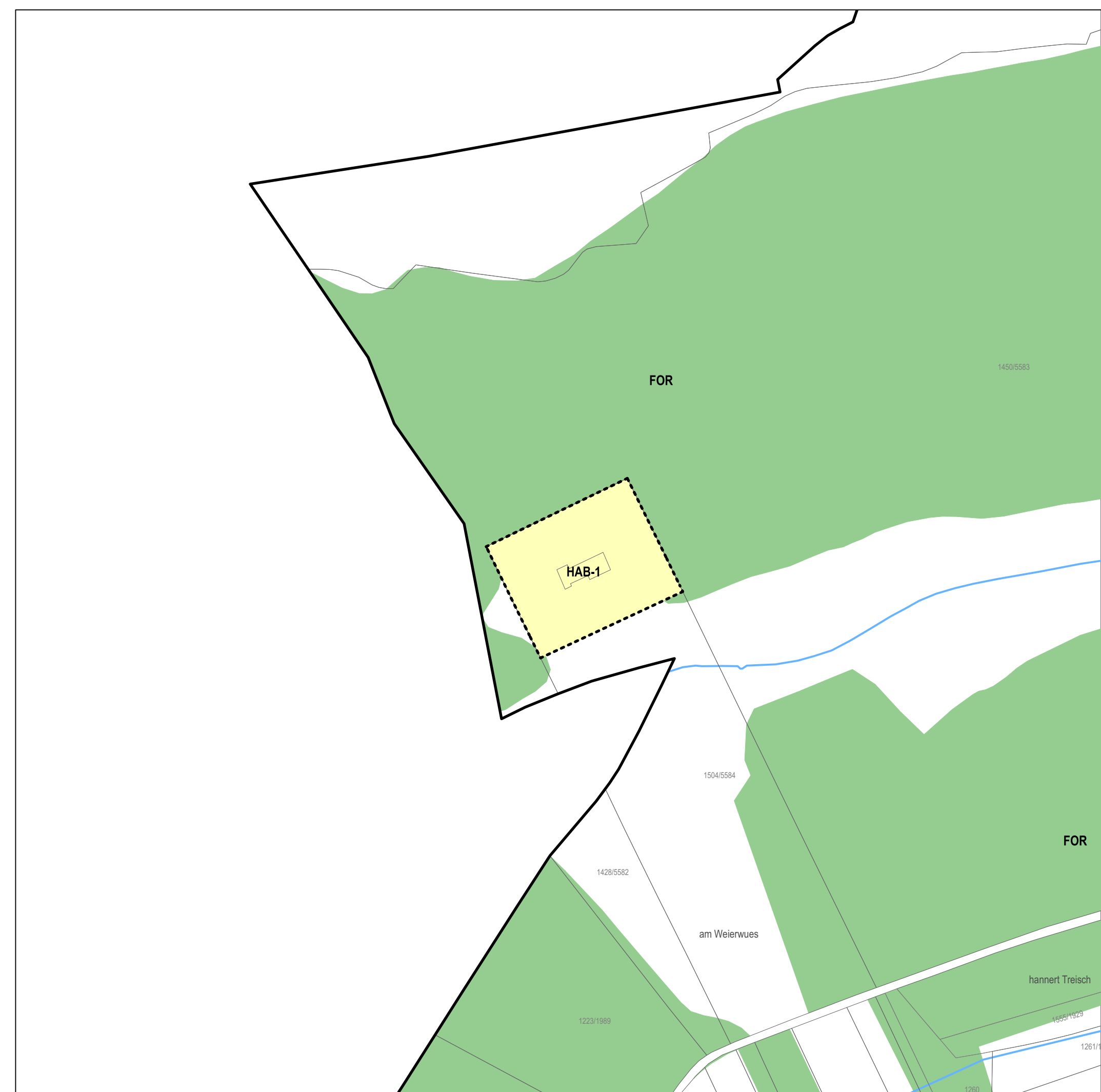
PARTIE GRAPHIQUE - PROJET D'AMENAGEMENT GENERAL - EXTRAIT FENTANGE QUEST