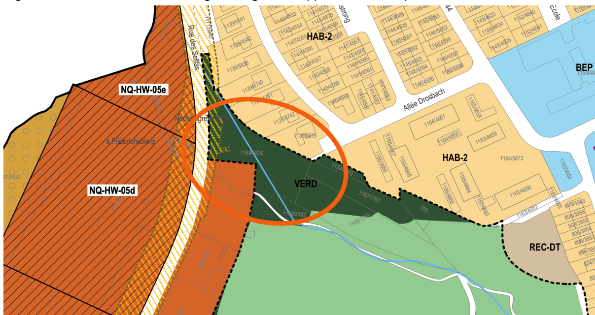
Figure 2 - Extrait du Plan d'aménagement général approuvé le 15 septembre 2020