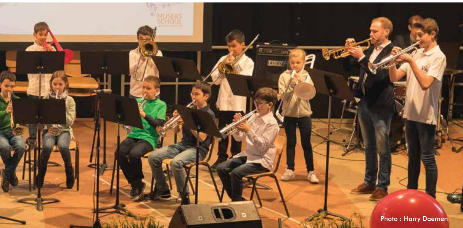
Remise de diplômes le 3 février 2019 au Centre Culturel Am Sand à Niedervanven